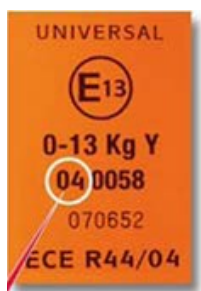
Abbildung 2 Etikette auf Kinderrückhaltevorrichtung ECE-Reglement Nr. 44

Kinderrückhaltevorrichtungen der Gruppe 3 (22–36 kg) sind auch für Kinder, die schwerer als 36 kg sind, geeignet.