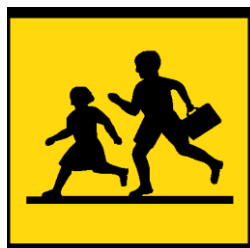
Abbildung 1 Kennzeichnung der Schulbusse

Kleinbusse und Gesellschaftswagen, die für Schülertransporte verwendet werden, dürfen vorn und hinten mit dem entsprechenden Kennzeichen versehen sein (siehe Abbildung 1). Dieses muss verdeckt oder entfernt werden, wenn das Fahrzeug nicht für Schülertransporte verwendet wird. 28